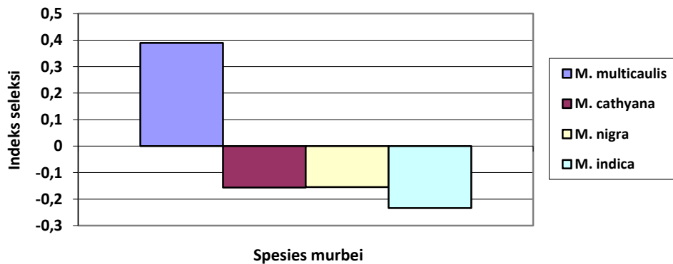
Gambar 2. Indeks selektivitas spesies murbei yang diberikan kepada kambing (n=6)

morfologik tanaman seperti lebar daun, intensitas bulu pada daun, tekstur dapat mempengaruhi taraf konsumsi (Loney et al. 2006; Barre et al. 2006). M. cathyana memiliki ukuran panjang dan lebar daun yang lebih besar dan jumlah bulu pada fraksi daun (abaxial dan adaxial) lebih rendah dibandingkan dengan ketiga spesies lainnya (Ginting et al. 2013). Kedua karakter morfologik tersebut diatas kemungkinan menyebabkan preferensi terhadap M. cathyana lebih tinggi.